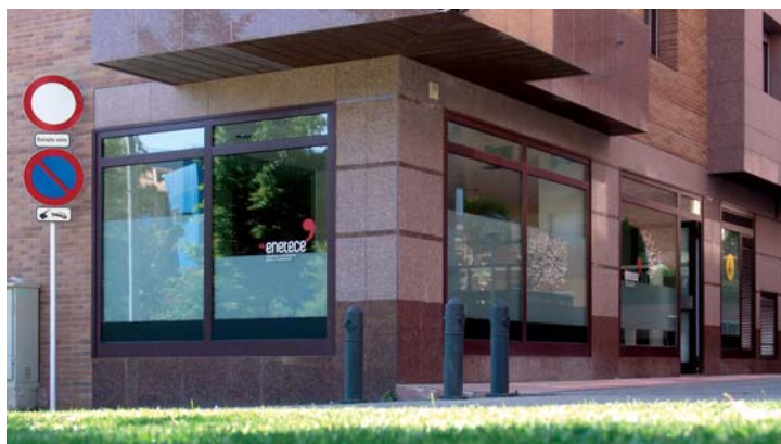
Les nostres oficines, C. de les Flors, 14 de Vic

L'edició de guies turístiques, guies de telèfons, plànols municipals, programes de festa major, revistes... són sens dubte una eina indispensable per a qualsevol municipi que tingui interès per mostrar al visitant les particularitats del municipi.